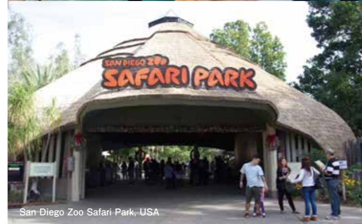
San Diego Zoo Safari Park, USA