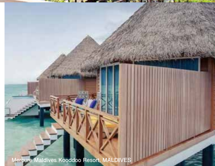
Mercure Maldives Kooldoo Resort, MALDIVES

VIROthatch は全天候性のため紫外線や熱に強く、10年は色褪せの心配がございません。厳しい屋外環境でも年間を通してご使用いただけます。また、有害物質を含まないため安全で、燃えても有毒ガスを発生させない環境にやさしい人工の茅葺き屋根です。「VIROTHATCH BALI」は、トーストブラウン、ライトタン、アイボリーの自然な色調の組み合わせが可能です。非常に自然な乾燥したわらぶきの外観に仕上がります。「VIROTHATCH JAVA」は、粗めのテクスチャになっています。より深いテクスチャの茶色と蜂蜜色の深い印象のオーセンティックな外観に仕上げます。